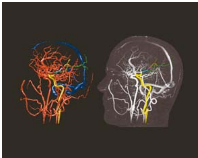
Räumliche Digitaldarstellung von Gehirngefässen.

Mit den vielfältigen Aspekten und Anwendungsformen der modernen medizinischen Informatik in Diagnose und Therapie befasst sich die eindruckliche Sonderschau «Computer.Medizin», die bis zum 1. Mai 2007 im Heinz-Nixdorf-Museumsforum in Paderborn gezeigt wird. Unter dem gleichen Titel ist dazu ein Katalog erschienen, in dem die Themen und Exponate der Ausstellung ausführlich vorgestellt werden (Schöningh-Verlag, Paderborn 2006, 360 S., Fr. 52.20).