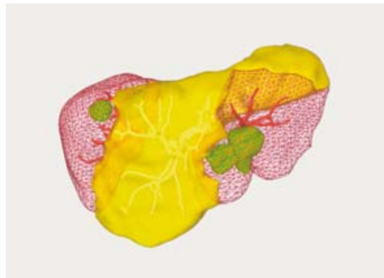
Virtuelles 3D-Modell einer Leber mit interaktiven Funktionen.

Die Software «Liver Analyzer» ist für die präoperative Planung in der Leberchirurgie entwickelt worden. Auf der Grundlage von computertomographisch ermittelten Daten und Bildern ermöglicht sie eine individuelle und detaillierte Risikoanalyse. (Aus dem Katalog zur Ausstellung «Computer.Medizin» des Heinz-Nixdorf-Museumsforums Paderborn.)